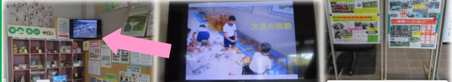
交流センターエントランスのモニターで小学校の映像を流しています！

名田島小学校は「コミュニティ・スクール」です！ コミュニティ・スクール（学校運営協議会制度）は、学校と地域住民等が力を合わせて学校の運営に取り組むことが可能となる「地域とともにある学校」への転換を図るための有効な仕組みです。 コミュニティ・スクールでは、学校運営に地域の声を積極的に生かし、地域と一体となって特色ある学校づくりを進めていくことができます。