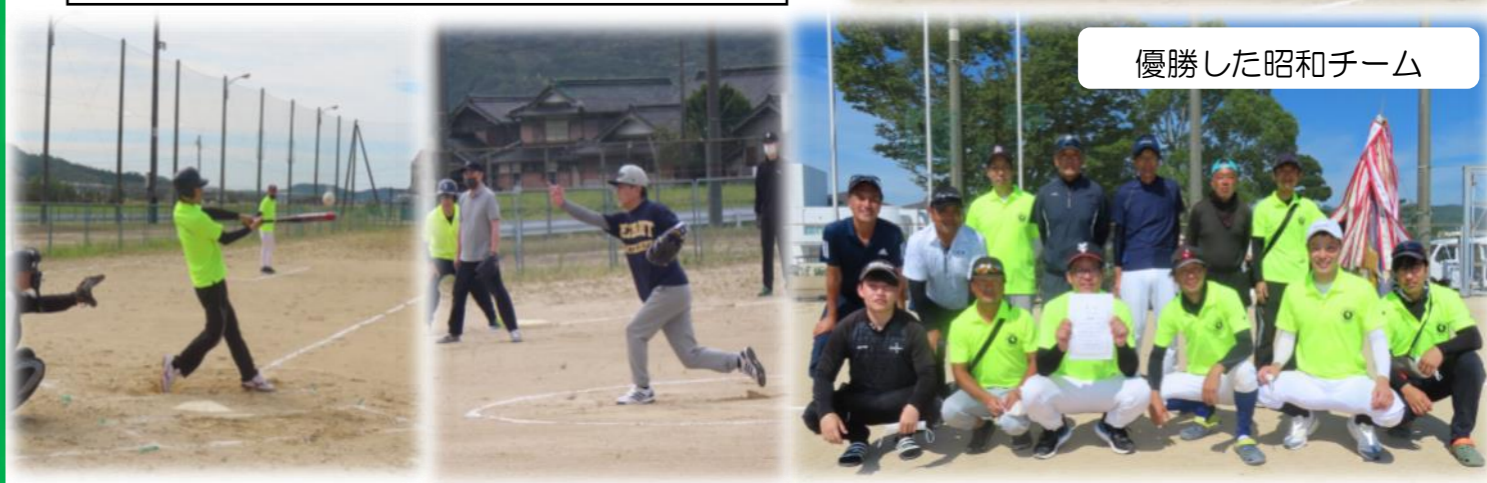
優勝した昭和チーム