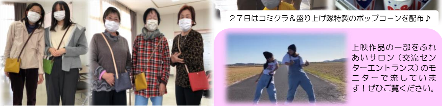
世界に1つだけの素敵なサコッシュが完成しました！