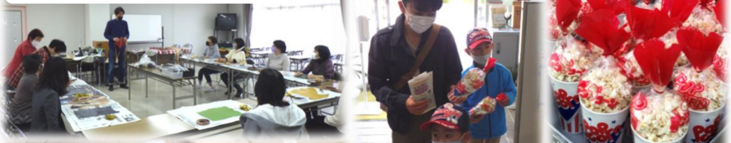
27日はコミクラ&盛り上げ隊特製のポップコーンを配布♪

27日にレザークラフト教室を開催しました。午前午後両部とも定員いっぱいの申込みがありました。