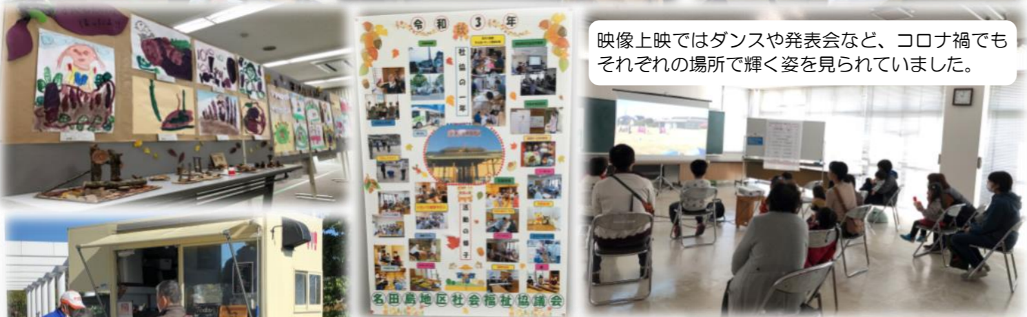
映像上映ではダンスや発表会など、コロナ禍でもそれぞれの場所で輝く姿を見られていました。