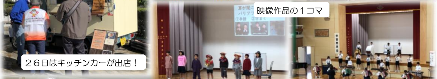
26日はキッチンカーが出店！

27日にレザークラフト教室を開催しました。午前午後両部とも定員いっぱいの申込みがありました。