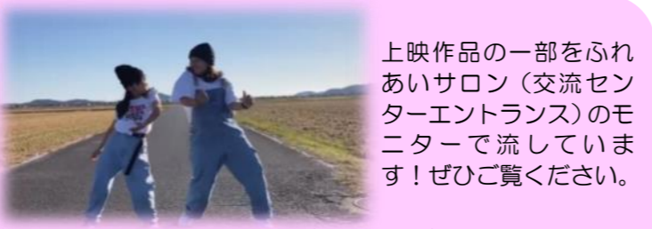
▲「WMAA」による名田島田園芸術祭のために作られたダンス動画も流しています！