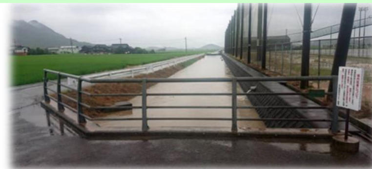
▲8月の大雨では、南総合センター駐車場入口前の河川の水位はかなり高くなっていました。