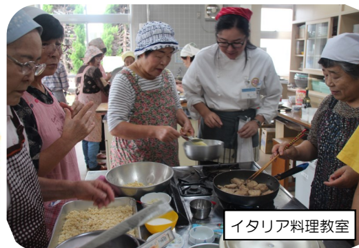
イタリア料理教室