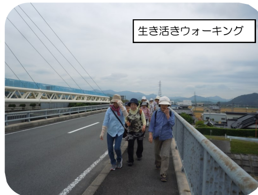
生き活きウォーキング