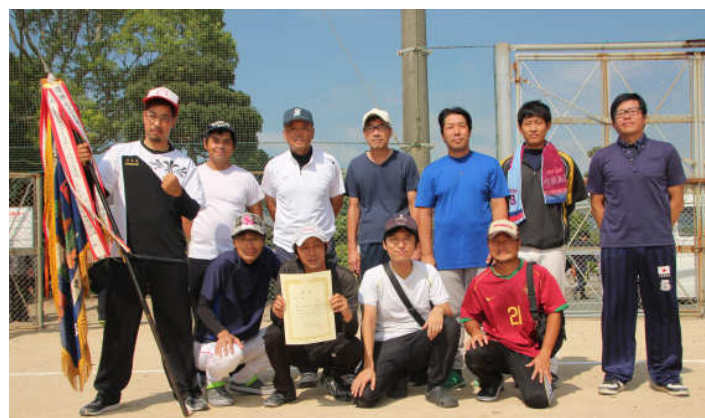
優勝した昭和チームの勇姿