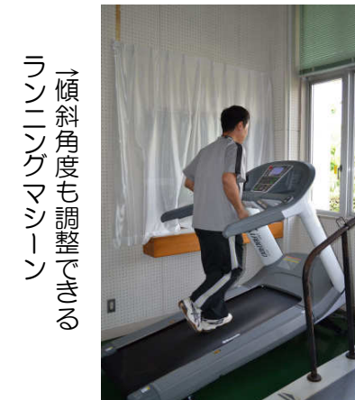
→傾斜角度も調整できるランニングマシン

定期的に通うアスリートから、自分のようなメタボが気になるだし年に数回だけ利用する人など老若男女様々な人が利用するトレーニングルームです。胸筋や腹筋を鍛えるマシンだけでなく、フィットネスバイクやランニングマシンなども揃っています。11月には山口市内をキャンプ地としているスペインの水泳代表チームも利用するそうです。