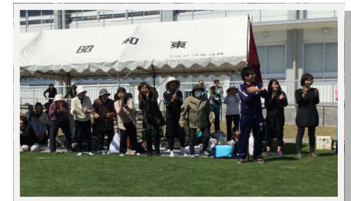
女性陣の応援も熱を帯びていましたね！