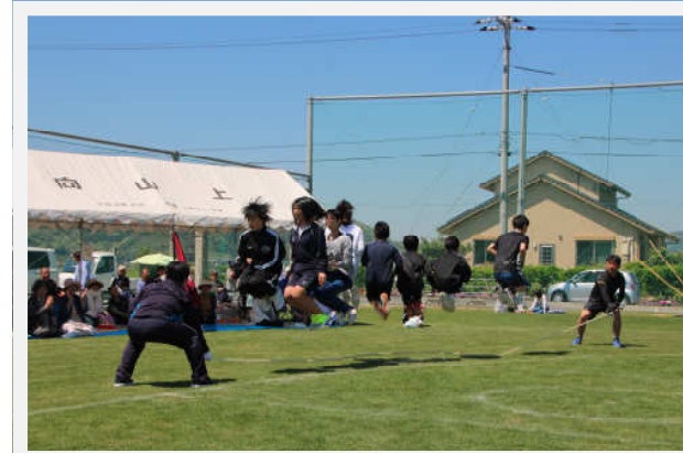
裸足でジャンプ！波乱の「ギネスに挑戦」