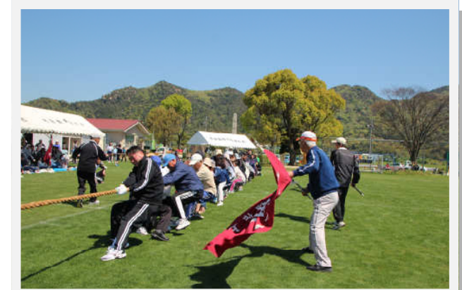
綱引きで地区同士の意気がぶつかり合う！！