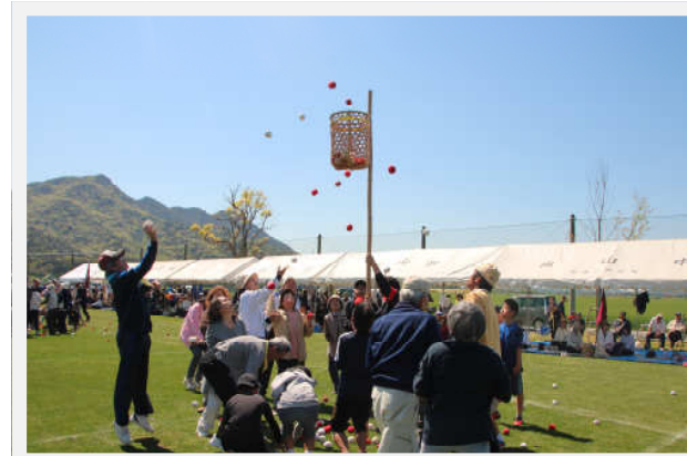
青空の中のみごまり。暑い！まぶしい！