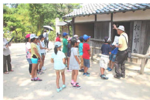
松下村塾にて。暑かったですね！

萩博物館では萩の城下町を再現した模型を見た後、美しいいきものたちにまつわるクイズに挑戦しました。