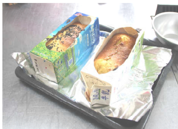
完成！玉ねぎの甘さがたまらない！