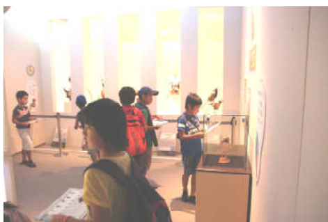
萩博物館。きれいな生き物がいっぱい！