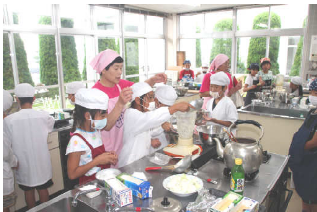
みんなで生地から作りました

食推の皆様に御協力いただき、名田島の特産品で作る「名田島ケーキ」を作りました。完成したケーキはおうちに持ち帰ってのお楽しみに。おいしくできたかな？