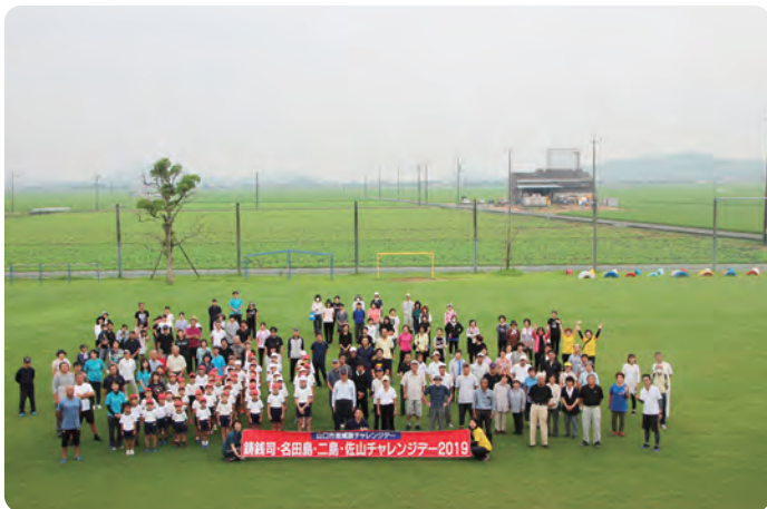
⑥ 地域版チャレンジデー 8月19日(土)