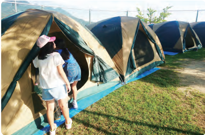
④ サマーキャンプ 7月27日～28日(木・金)