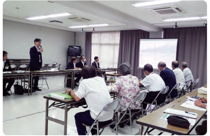
① 移動市長室 7月12日(水)