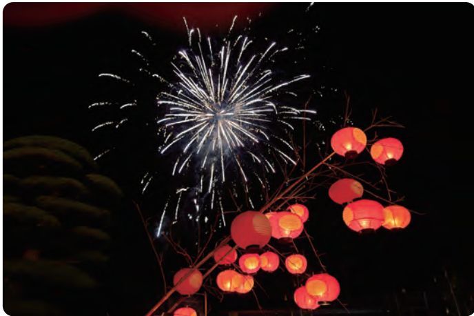
② ちょうちんちょこっとまつり 7月22日(土)