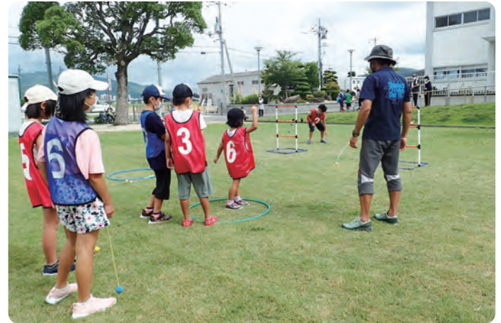
⑤ サマースタディ 8月2日～8月29日 7講座