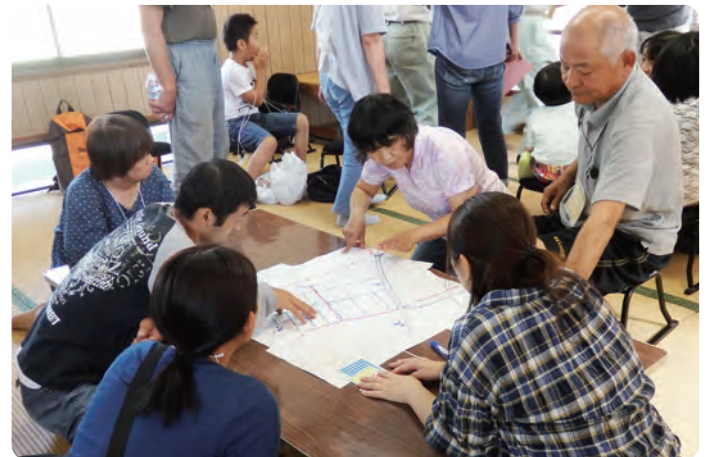
⑦ 名田島地区自主防災訓練 8月27日(日)