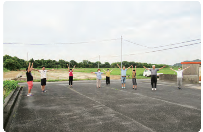
③ 夏休みラジオ体操 7月21日(金)～