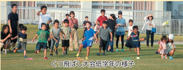
くつ飛ばし大会低学年の様子

低学年の部、高学年の部、大人の部で行い、最高記録は、大人の部で31.5mでした。