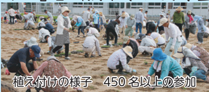
植え付けの様子 450名以上の参加

区民などグラウンドの利用状況までをスライドにより紹介しました。芝生化の経費が約1千万円かかっていることも報告されました。