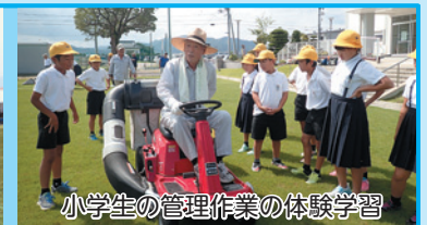
小学生の管理作業の体験学習