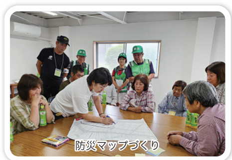
防災マップづくり