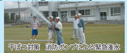
干ばつ対策 消防ポンプによる緊急灌水