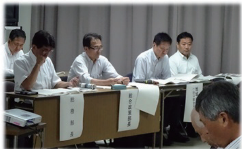
市の各部長も出席

最後の意見交換では、交流人口の増加をめざすフットパスの導入、災害対策も視野に入れた南蛮樋の保存・整備計画、非常時における地域住民への避難の呼びかけ方法などについての提案があり、それぞれに対して市長や各部長から、市としての考え方についての説明がありました。