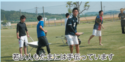
若い人もたまには手伝っています