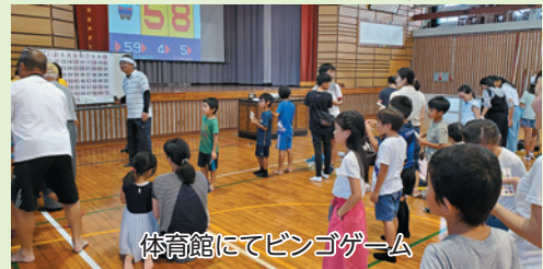
体育館にてビンゴゲーム